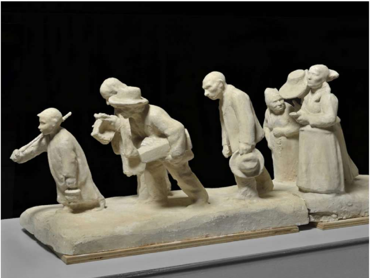
'L'enterrement d'un enfant en Périgord', sculpture de Jane Poupelet, 1904