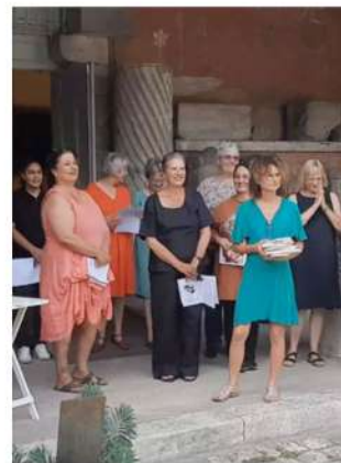
Atelier d'Ecrit de Femmes solidaires