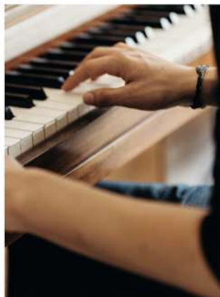
élèves pianistes du conservatoire de Dordogne